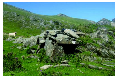
Un tumulus à la Pierre St-Martin