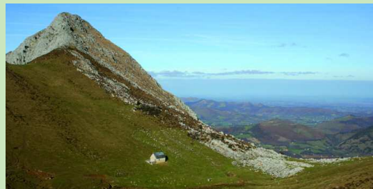
La montagne de Napatch.

CIRCUIT N°21 / ISSOR TUMULUS DE LA SERRE