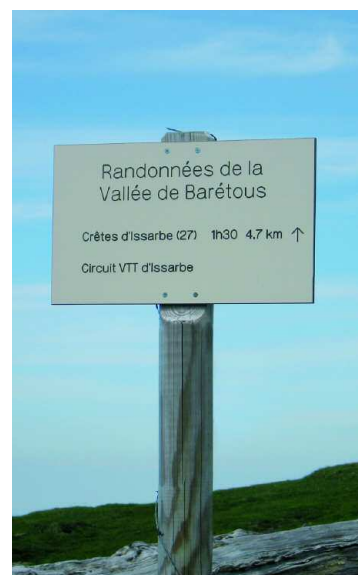
Une photo locale des sentiers ou balisage

Durée de la randonnée : La durée de chaque circuit est donnée à titre indicatif. Elle tient compte de la longueur de la randonnée, des dénivelées et des éventuelles difficultés.