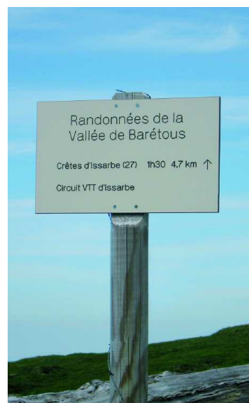
Une photo locale des sentiers ou balisage

Durée de la randonnée : La durée de chaque circuit est donnée à titre indicatif. Elle tient compte de la longueur de la randonnée, des dénivelées et des éventuelles difficultés.