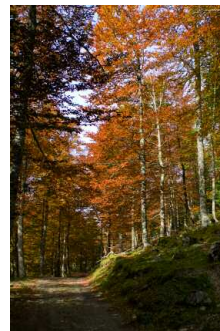
Paysage d'automne dans la forêt de Soulaing.

Continuez sur la piste principale dans le bois pour rejoindre votre point de départ.