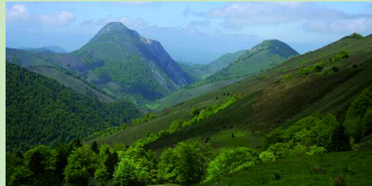
La vallée entre le pic de Sudou et le Soum de Liorry.

C 'est le belvédère le plus avancé pour contempler les Arres de l'Anie, balcon grandiose vers le Sud, cette boucle est aussi une promenade forestière qui prodigue de belles vues sur les plaines.