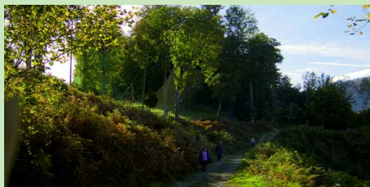
Un sentier agréable avant d'arriver aux Pantières.

CIRCUIT N°13 / LANNE EN BARÉTOUS CHEMIN DES PANTIÈRES