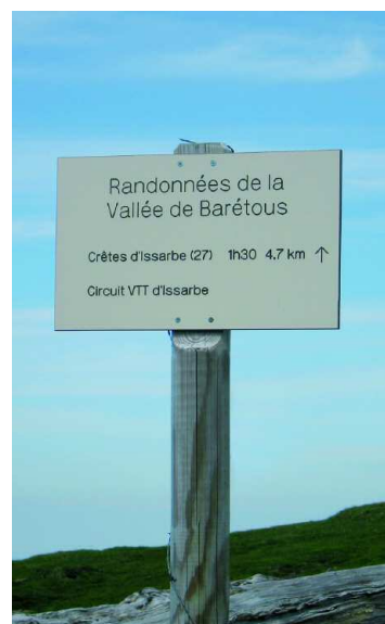
Une photo locale des sentiers ou balisage

Durée de la randonnée : La durée de chaque circuit est donnée à titre indicatif. Elle tient compte de la longueur de la randonnée, des dénivelées et des éventuelles difficultés.