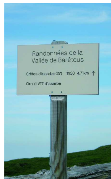
Une photo locale des sentiers ou balisage

Durée de la randonnée : La durée de chaque circuit est donnée à titre indicatif. Elle tient compte de la longueur de la randonnée, des dénivelées et des éventuelles difficultés.