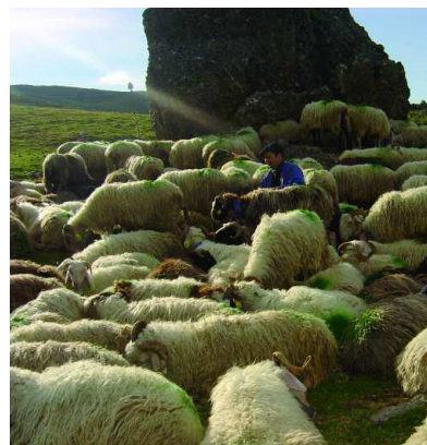
Découverte du pastoralisme à Issarbe, avec la traite traditionnelle.