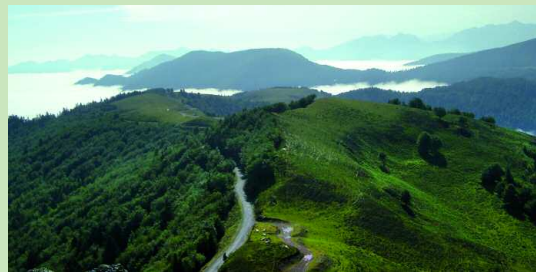
Chemin de randonnée.

C ercles rudimentaires de pierres : les tumulus attestent d'une antique activité pastorale. Ici, rien n'a changé, vous pouvez contempler les mêmes paysages que les bergers d'autrefois. Les crêtes de Sautirou et de Mustayou vous invitent à d'autres randonnées.