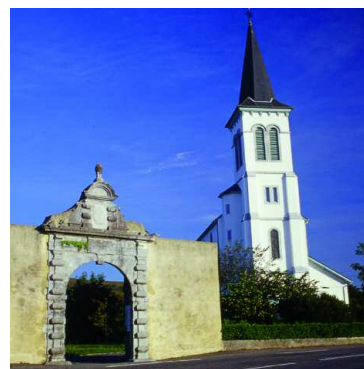
Le portail près de l'église d'Aramits.

③ 30T0684321E-4779603. Il ne vous reste plus qu'à la suivre pour retrouver les installations d'Aventure Parc® et votre lieu de départ.