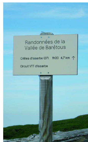
Une photo locale des sentiers ou balisage

Durée de la randonnée : La durée de chaque circuit est donnée à titre indicatif. Elle tient compte de la longueur de la randonnée, des dénivelées et des éventuelles difficultés.